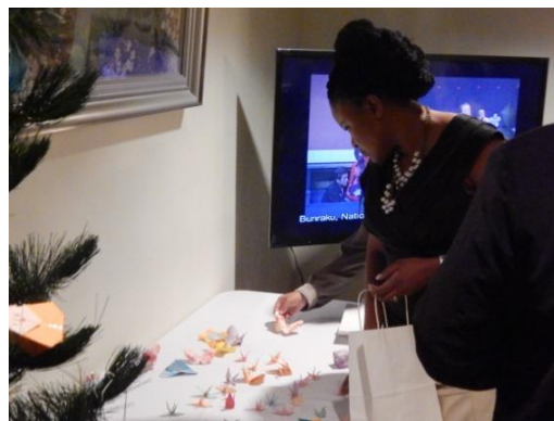
日本文化/折り鶴展示、希望者への提供（左：モーゼス外務大臣 右：ギャツビー＝ドリー文化大臣）