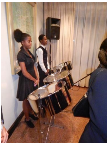
国歌演奏/ スティールパン奏者

今回のレセプションでは、日本文化紹介として、日本酒のPR、寿司実演・提供、盆栽の展示、折り紙展示・提供の他、写真パネルを展示しました。