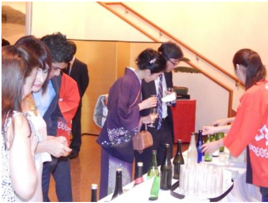
日本産酒/ 日本各地の銘酒を展示、試飲提供