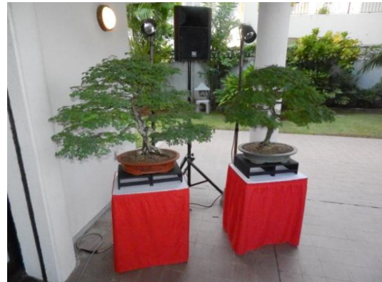
日本文化/ 盆栽展示