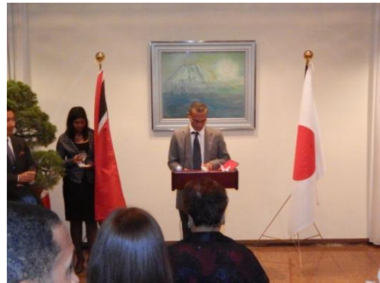
先方スピーチ/ モーゼス外務大臣