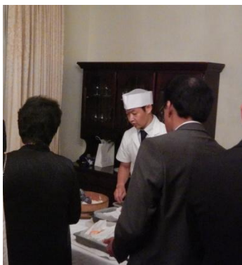
和食提供/ 握り寿司実演・提供